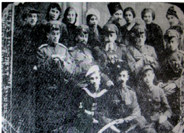
החוג הדרמטי בהצגה "המשפט", 1934

כך פעלו החוגים לפני שנים רבות בהנהגת אלתר שמש וגדליה שמש.