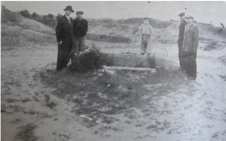
יוסף קלימבורד (!), בנימין אייזנברג ואחרים על קבר האחים בדרך קופצ'יווקה