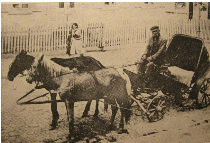
שמעון יוסל בעל-עגלה.