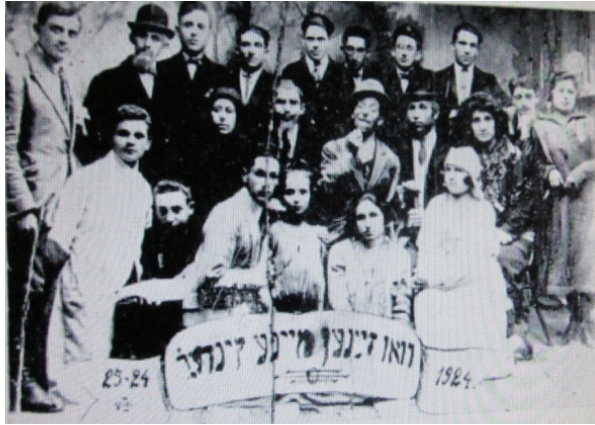
החוג הדרמטי שליד בית הספר העממי בהצגה "היכן הם ילדי", 1924

הצגה זו זכתה אף היא להצלחה גדולה. החוג הפך להיות פעיל יותר. מדי שישה שבועות הצגה חדשה: "פינטעלע ייד", "אלוהים, אדם ושטן", "טוביה החולב".