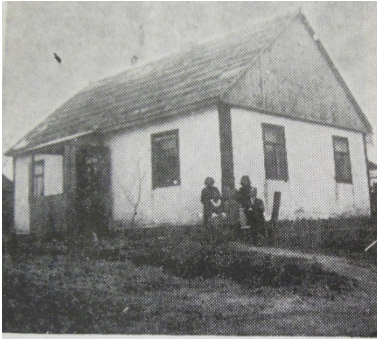
בית-היתומים. שהפך לבית-מריבה. לבסוף