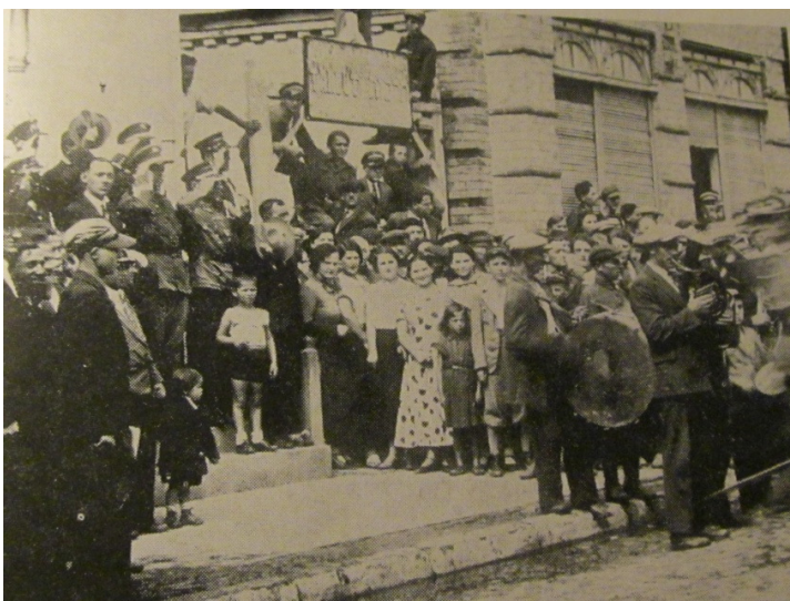
קהל חוגגים ביום חג פולני בכניסה לבית הספר "תרבות", מימין בית מנדל גרברסקי