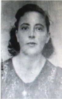
בתצלום: פולה דיכטר