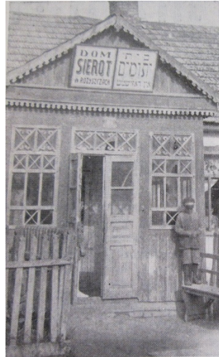
בית היתומים הישן בבית גלייזל