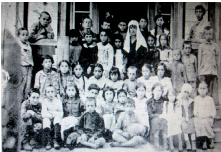
כיתה בבית הספר העממי עם מורתה

נכון, כספית היינו בצרות צרורות, אך הנחת ששאבנו מן ההישגים חיזקו אותנו. בית הספר רכש לעצמו שם באזור כולו.